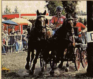
Bei der Marathonfahrt wird einiges ab-verlangt.

Der Sonntag startet mit den Marathonfahrten rund um Bösdorf. Mit zwei neu-gebauten Hindernissen be-kommt die Strecke wieder einen hohen Anspruch und fordert Pferd und Fahrer ei-niges Können ab. Aber auch in diesem Jahr ist der große Zuschauermagnet der Hin-dernisplatz am Ortseingang. Die drei Hindernisse, die zu