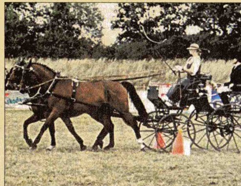
Der Hindernisparcours fordert Pferd und Fahrer gleichermaßen.

An allen drei Tagen ist für eine ausreichende kuli-narische Versorgung ge-sorgt. Ein interessanter Ausstellungsbereich steht für Informationen bereit. Für die kleinsten Besucher gibt es tolle Spielmöglich-keiten und weitere Unter-haltung.